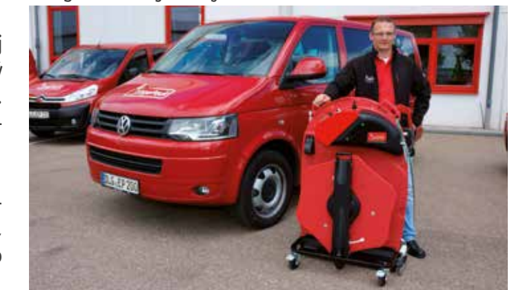
ErgoPack vykonáva pri dodávke zariadení zaškolenie pracovníkov zákazníka.

Spolu bolo predaných už viac ako 8 500 ErgoPack systémov v 55 krajinách sveta. Stroje sú jednoduché na obsluhu. Aby išlo od začiatku všetko hladko, experti ErgoPacku zabezpečujú zaškolenie zamestnancov priamo v priestoroch zákazníka pri dodávke systému. ErgoPack – meno hovorí za všetko: ergonomické páskovanie paliet a tovaru. S ErgoPackom je zohýbanie už minulosťou.