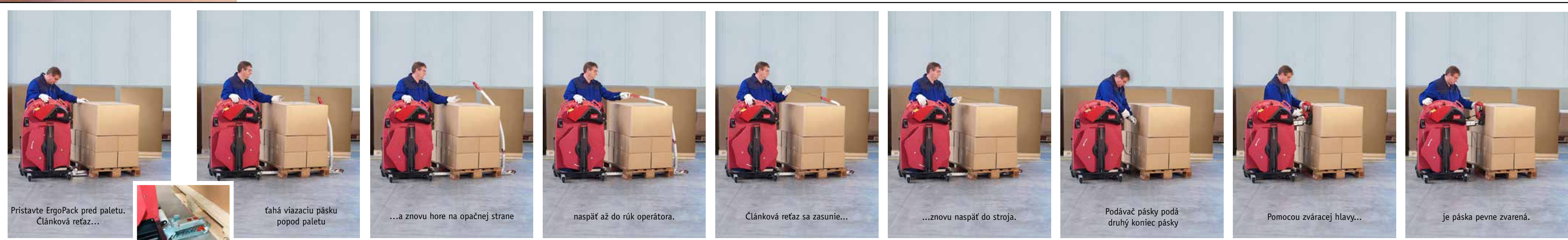
Pristavte ErgoPack pred paletu. Článková reťaz...